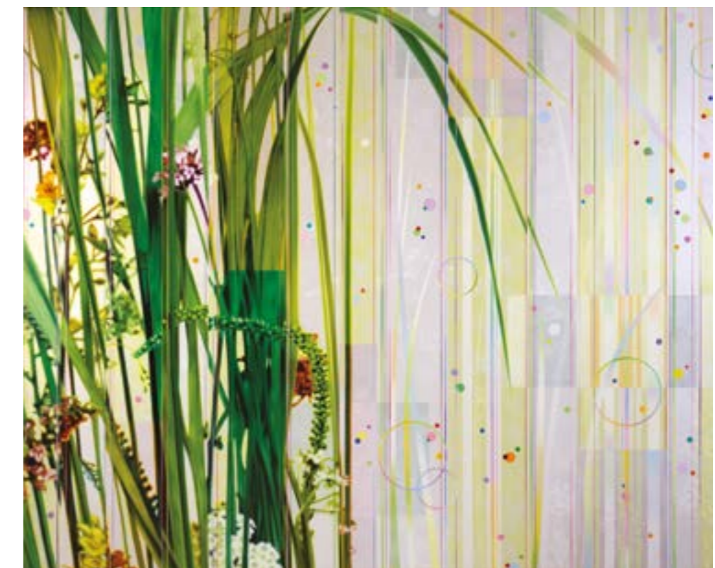
Dany Vesconi, s.l., 2014, tecnica mista su lino, 150 x 200 cm, Collezione privata - www.danyvesconi.com

Per informazioni: www.casadelmantegna.it www.allafinedeiconti.it